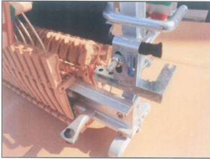
低音部取り付け実例